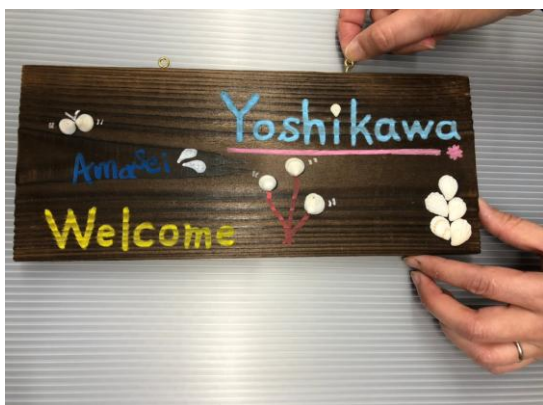
⑦ヒートンをつける