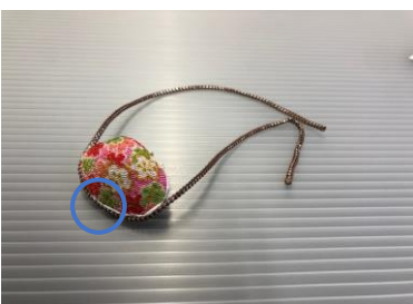
⑪ひもの真ん中に貝を 貼り付ける