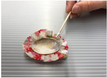
⑥布にポンドをぬる