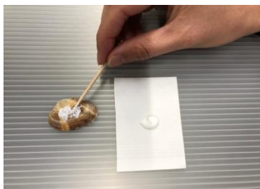
②貝殻の表面に薄くポンドをぬる