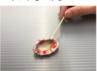
⑨片方の貝の内側にポンドをつける