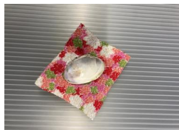
③布の裏側に貝をつける