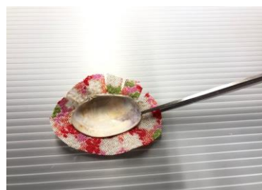
⑤布の周りに切れ目を入れる