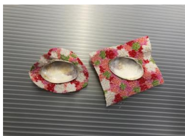
④布を貝より1cmくらい大きめに切る