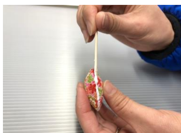
⑩貝を貼り合わせる みぞにポンドをぬる