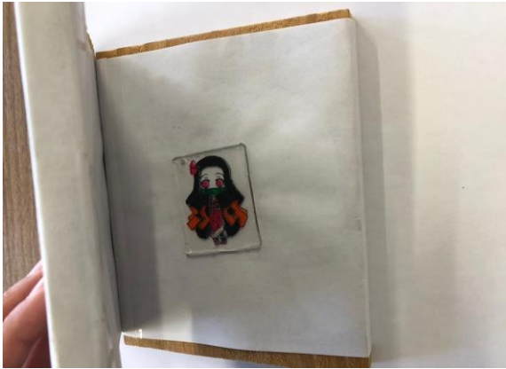
⑦木の板で押さえて平らにする