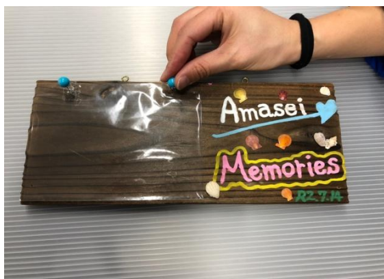
⑦ファイル・ヒートンをつける