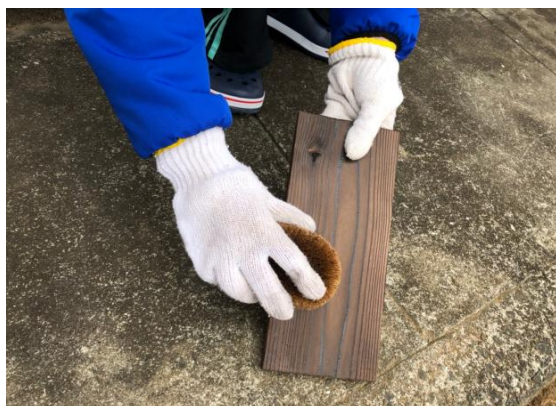
③たわしですすを落とす