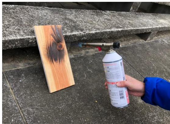
②ガスバーナーで板を焼く