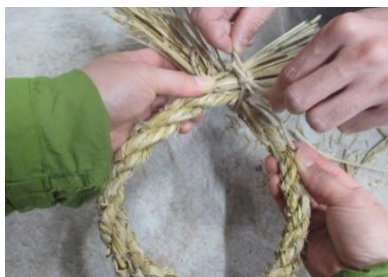
⑫円を作る (ひもで結ぶ)