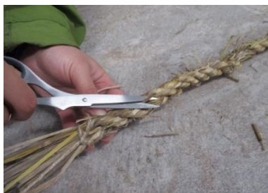
⑪飛び出ているわらを切る