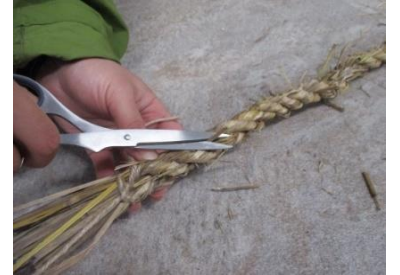
⑨飛び出ているわらを切る