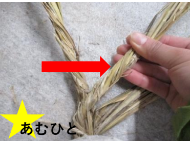
⑦編む人から見て 左回りに編む