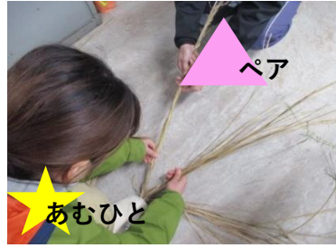
⑤ペアと向かいあう