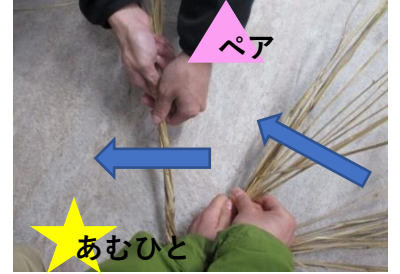
⑥編む人から見て 左回りにねじる