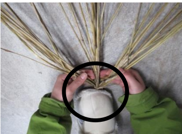
④3等分する (結び目を踏む)